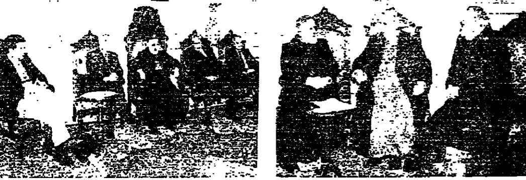
مع الرابطة اللبنانية البيروتية صفر البيروتية بيد اويد ومهران الموصلي